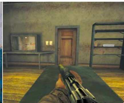
AUSRÜSTUNG Ignorieren Sie das Verbotsschild und brechen Sie die Vitrine mit dem neuen Gewehr auf.