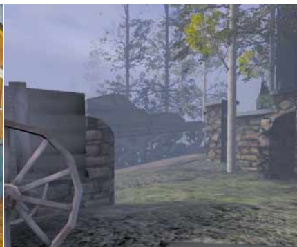
DECKUNG Greifen Sie von hier an. Der Panzer schießt gegen die Mauer und erledigt sich damit quasi selbst.