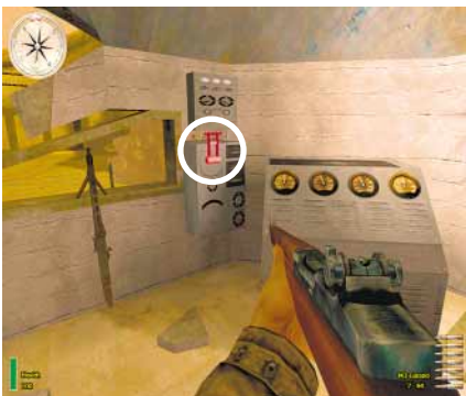
TORÖFFNER Der Hebel in der zerstörten Bunkerkuppel öffnet das schwer bewachte Haupttor.

Erledigen Sie den Kerl hinter dem MG des Wachturms. Auf dem Laufsteg des Towers ist