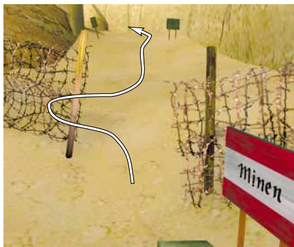
VORSICHT, MINEN! Wenn Sie diesen Weg benutzen, können Sie sich den Minensucher sparen.

Mit den Papieren kommen Sie unbemerkt in das Hafengebiet. Der Schiffswächter zeigt sich