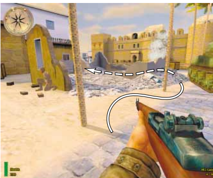
KLEINE ÜBERFAHRT Schleichen Sie zum Kai und biegen Sie links ab. Der Chauffeur wartet schon.