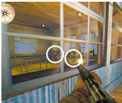
SCHLAFMÜTZEN Die Funker machen Ihnen keinen Ärger, wenn Sie sie leise durch die Fenster erledigen.

Überqueren Sie nun die Straße – drei Schützen wollen Sie daran hindern. Durch die Tür gelangen Sie auf einen Hof. Auch hier müssen Sie einige Feinde erledigen. Vorsicht: Ein durchaus fähiger Scharfschütze steht auf einem Balkon im Osten. Auf der LKW-Ladefläche finden Sie Munition. Eine Treppe führt hier nach unten. Unter der Zeltplane verschanzen sich zwei harte Gegner, drei weitere stürmen durch die Tür ins Freie. Im Inneren können Sie bis zu 50 Lebenspunkte per Verbandskasten auffrischen. Hinter der Tür auf der rechten Seite steckt ein Offizier, dem Sie mit bleiern Überredungskünsten einen Schlüs-