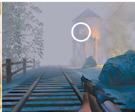
VERSTECKT Die Italiener haben sich in dem Wasserturm eingenistet und bewachen die Brücke.