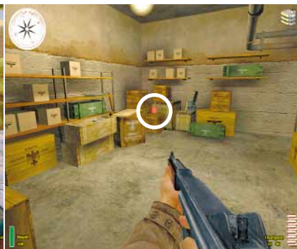
RÜCKZUG Nachdem Sie die Bombe im Munitionsraum gelegt haben, bleiben Ihnen 30 Sekunden.